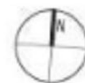
Erdgeschoss / 1. Stock